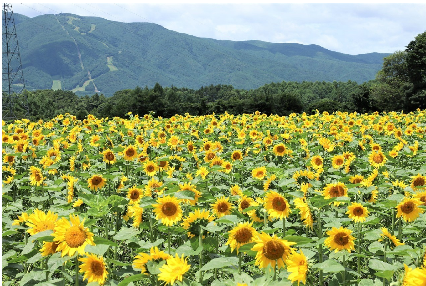
撮影場所 諏訪郡富士見町